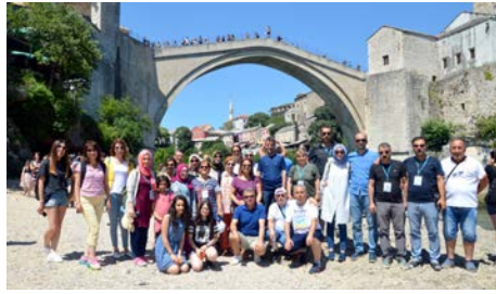
Kafile Mostar Köprüsü önünde hatıra fotoğrafı çekildi.