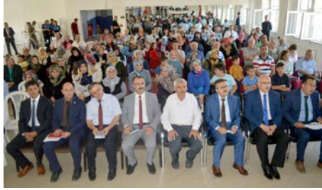
Toplantı Cumhuriyet Ortaokulu'nda gerçekleştirildi.