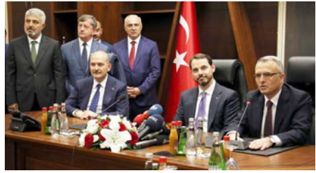
Naci Ağbal ise görevini Hazine ve Maliye Bakanı Berat Albayrak'a devretti.