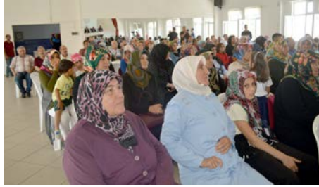
Vatandaşlar taleplerini dile getirdiler.