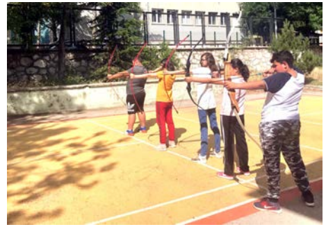
Zirve Fitness çalışmalarına katılan çocuklar okçuluk branşında da çalışma yapıyorlar