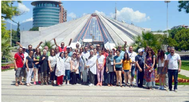
Türk- Eğitim Sen Çorum Şubesi, Balkanların tarihi, kültürel ve turistik mekânlarını gezdi.