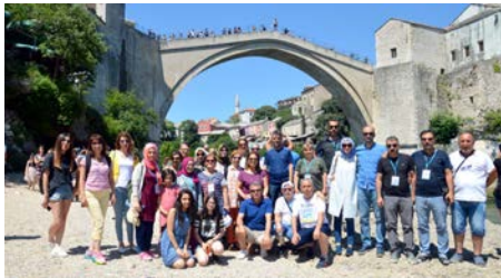
Kaflele Mostar Köprüsü önünde hatıra fotoğrafı çektiler.

■ Türk- Eğitim Sen Çorum Şubesi, 'Tarihin İzinde Balkanlar' etkinliği adı altında Balkanların tarihi, kültürel ve turistik mekânlarını gezdi.