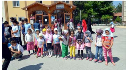
İlim Yayma Camii'ne 250 civarında öğrenci kayıt yaptırıldı.

Kur'an öğrenme isteği bizleri ziyadesiyle memnun etmektedir. Biz de İlim Yayma Cemiyeti olarak, sınıflar oluşturulması, sosyal, kültürel ve sportif faaliyetlerin yapılabilmesi için yurt binamızın fiziki mekânlarımız