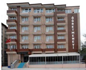
Öğretmenevi'nde 2 düğün salonu inşaatı devam ediyor.

Konu ile ilgili Valilik'ten yapılan açıklamada; "Öğretmenevi'nin başta düğün salonları olmak üzere onarım inşaatı işi kısa bir süre içerisinde tamamlanarak yeniden hizmete açılacaktır." denildi (Haber Merkezi)