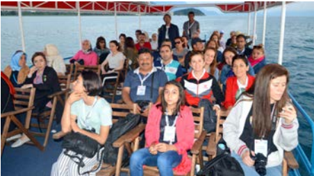
Ekip Ohrid'de tekne turuyla günün yorgunluğunu attı.