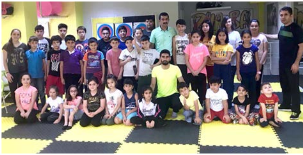
Zirve Fitness Salonundaki çocuklar verilen eğitimlerde teorik ve pratik testler yapılarak gelişimlerine katkı sağlanıyor