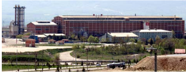
Fabrikayı devralan şirket yetkilileri, yeni idari yapılarına kapsamında gerekli görevlendirmeleri de yaptı.