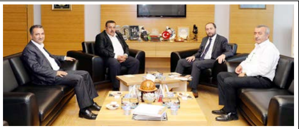
Ziyarete birlikte yapılabilecek çalışmalar değerlendirildi.