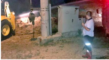
Yangına itfaiye ekipleri müdahale etti.