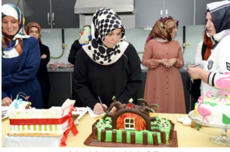
Jüri üyeleri pastaları değerlendirdiler.

Corum Belediyesi Kadın Kùltür ve Sanat Merkezi tarafından Buhara Kùltür Merkezi'nde düzenlenen yarışmada pastacılık bölümü öğrencileri hünelerini sergiledi.