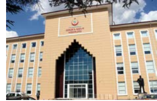
Psikososyal destek birimi İl Sağlık Müdürlüğü'nde Sağlıkli Hayat Merkezi içerisinde yer alıyor.