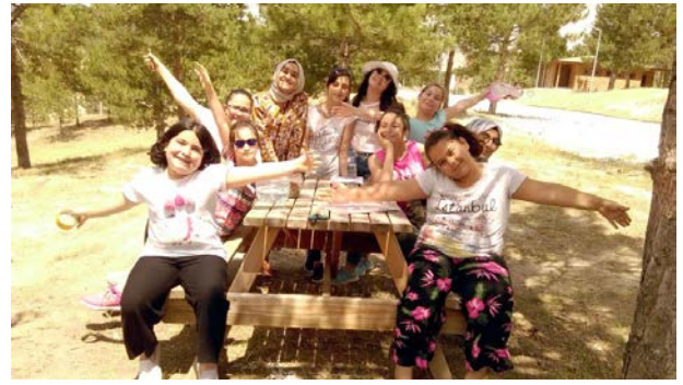
Öğrenciler eğitimlerde gönüllülerle eğleniyor.