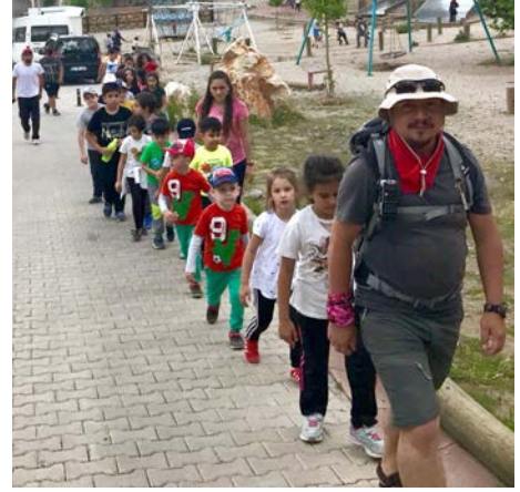
Salonda etkinliklere katılan çocuklar rehber öğretmen önderliğinde doğa gezisini yaptılar