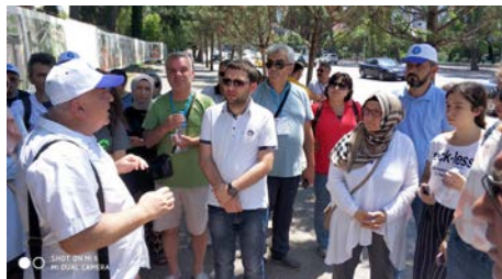
Kafile gezdiği yerler hakkında profesyonel rehberden bilgi aldı.