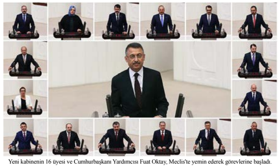
Yeni kabinesinin 16 üyesi ve Cumhurbaşkanı Yardımcısı Fuat Oktay, Meclis'te yemin ederek görevlerine başladı.

Enerji ve Tabii Kaynaklar Bakanı Fatih Donmez, Ulaştırma ve Altyapı Bakanı Mehmet Cahit Turhan, Çevre ve Şehircilik Bakanı Murat Kurum, Tarım ve Orman Bakanı Bekir Pakdemirli, Kültür ve Turizm Bakanı Mehmet Ersoy, Gençlik ve Spor Bakanı Mehmet Muharrem Kasapoğlu, Hazine ve Maliye Bakanı Berat Albayrak, Ticaret Bakanı Ruhsar Pekcan, Sanayi ve Teknoloji Bakanı Mustafa Varank yemin ederek görevlerine resmen başladılar.