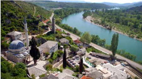
Bosna Hersek'teki Osmanlı köyü Poçtel.