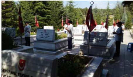
Öğrenciler şehitler için dua ettiler.