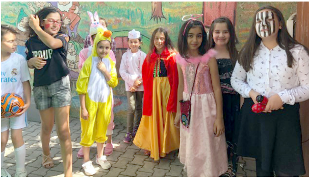
İlköğretim çağındaki 7-14 yaşları arasındaki çocuklar ücretsiz eğitim alabiliyor.