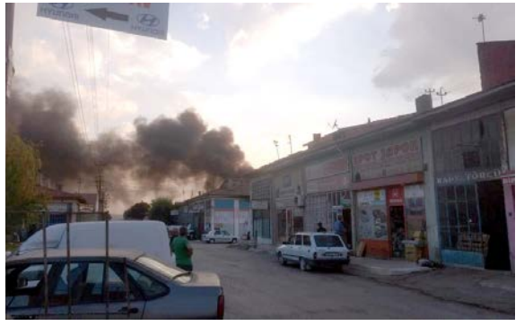
Yangın Aşağı Sanayi Sitesi'nde bulunan bir dükkanda çıktı.