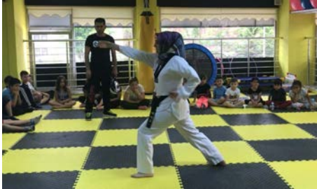
Tekvando faaliyetleri uzman hocalar gözetiminde yapılıyor