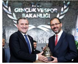
Metmet Kasapoğlu (sağda), görevi Osman Aşkın Bak'tan devraldı.