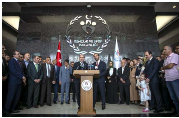
Gençlik ve Spor Bakanlığı'nda gerçekleşen devir teslim törenine ilgi büyüktü.