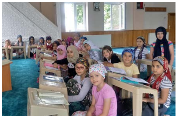
250 öğrenciyi 11 eğitimci ile kurs veriliyor.