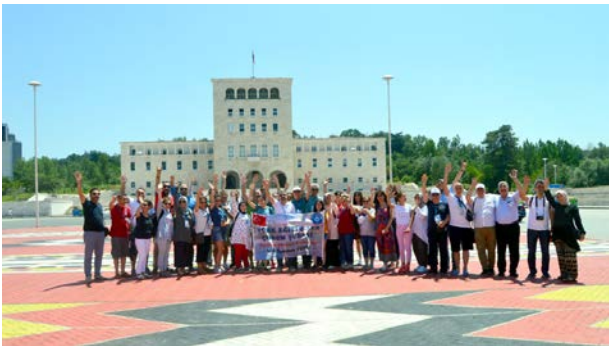
Türk- Eğitim Sen Çorum Şubesi, "Tarihin İzinde Balkanlar" etkinliği kapsamında Yunanistan, Makedonya, Amavutluk, Bosna Hersek, Sırbistan ve Bulgaristan'ı gezdi.