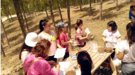
TEGV Çorum Öğretim Birimi Anadolu Yaz Gönüllüsü Projesi kapsamında 2 proje için 3 gönüllüye misafir ediyor.

Türkiye Eğitim Gönüllüleri Vakfı'nda yaz etkinliklerinden Temmuz ayının sonuna kadar devam edeceği belirtiliyor. (Haber Merkezi)