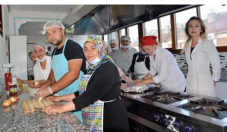
Aşçı Kursu'na katılan kursiyerlere 450 saatlik ders programı uygulanacak.

Halk Eğitim Merkezinde devam eden Aşçı Yardımcısı Kurs Programına katılan kursiyerler; Çalışanların İş Sağlığı ve Güvenliği, Besin Öğeleri ve Besin Grupları, Hijyen ve Sanitasyon, Buluşuk Yıkama ve Çöp Atımı, Sebze/ler Pişirmeye Hazırlama, Sebze Garnitürleri, Fond ve Temel Çorbalar başlıklarından oluşan modüllere göre toplam 450 saat ders görüyor. Alan öğretmenleri tarafından uygulanan kurs programı ile kursa katılan bireylerin sorumluluk, doğruluk ve dürüstlük, ahlak, çalışkanlık, sabır, nezaket gibi değerlerini kazandırılması ve geliştirilmesi de hedeflenmektedir. (Haber Merkezi)