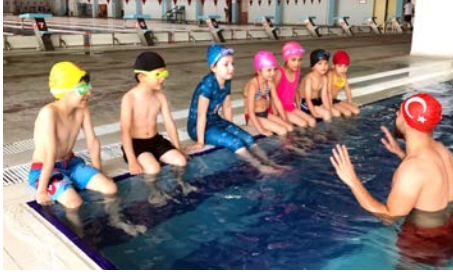
Zirve Fitesda yüzme çalışmalarına katılan minikler yüzme öğretmene çalışıyor