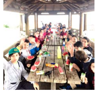
Çalışmalar sonunda birlikte piknik yapıyor

Sağlıklı nesillere spor kültürünü ve eğitimini alan çocuklara ulaşılabiliyor. Tüm velilerden istediğimiz çocukların spor alanlarına yönlendirmelerini ve istekli kabiliyetli olduğu branşta çalışmalara