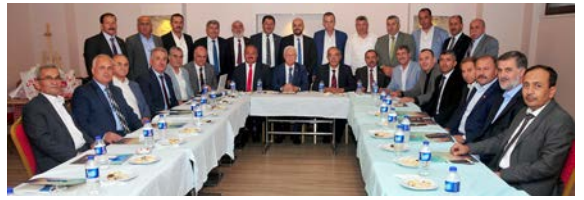
TŞOF Danışma Kurulu Meclisi ilk toplantısını yaptı.