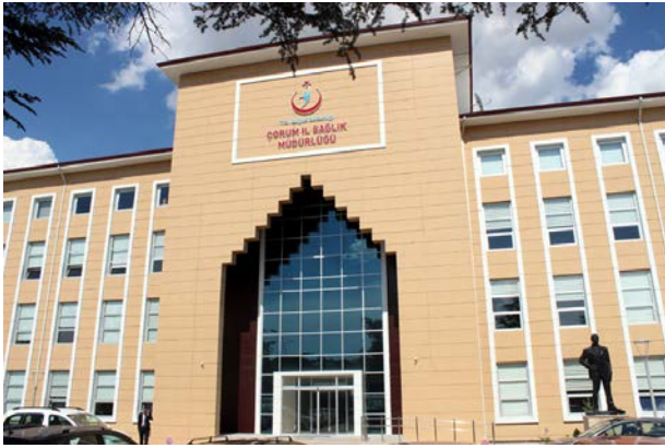
Psikososyal destek birimi İl Sağlık Müdürlüğü'nde Sağlıkli Hıyat Merkezi içerisinde yer alıyor.