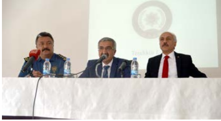
Toplantı Vali Necmeddin Kılıç'ın başkanlığında yapıldı.