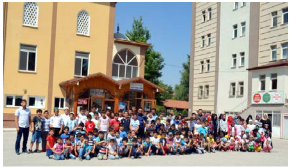
Kursa öğrencilerin ilgisi yüksek.