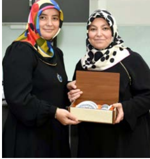
Yarışmada dereceye giren isimlere çeşitli ödülleri verildi.