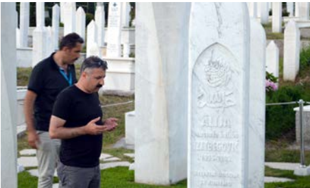
Saraybosna'da son durak ise Bağımsız Bosna Hersek'in ilk cumhurbaşkanı, Aliya İzzetbegović'in anıt mezarı oldu.