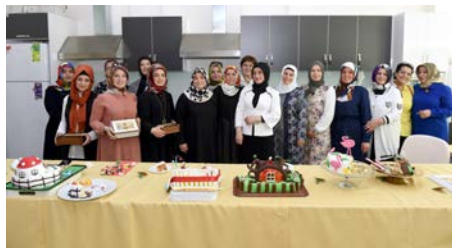
Yarışmaya 9 kursiyer katıldı.

■ Çorum Belediyesi Kadın Kültür ve Sanat Merkezi tarafından Buhara Kültür Merkezi'nde düzenlenen yarışmada pastacılık bölümü öğrencileri hünelerini sergiledi.