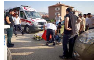
Yaralı polise ilk müdahaleyi 112 ekipleri yaptı.